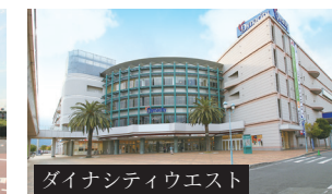
ダイナシティウエスト