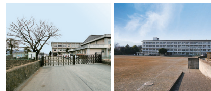
向田小学校 足柄台中学校